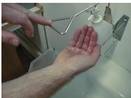
1. Använd rikligt med alkoholbaserat handdesinfektionsmedel.

Handdesinfektion utförs på följande sätt: