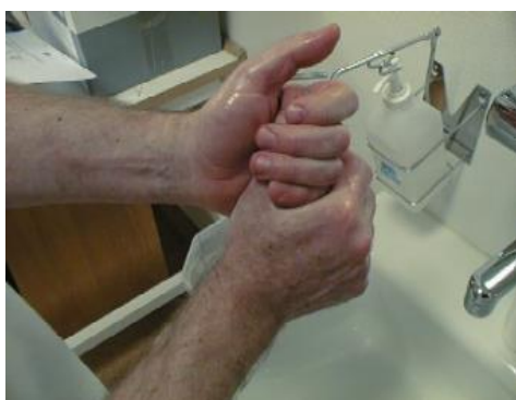
3. Glöm inte tummar och mellan fingrar...