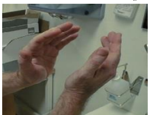
5. ...och fortsatt gnida tills händerna är torra.

Handtvätt avser att reducera eller avlägsna smuts. Tvätta händerna när de är smutsiga eller känns smutsiga. Använd vanlig flytande tvål och vatten och torka därefter torrt med engångshandduk.