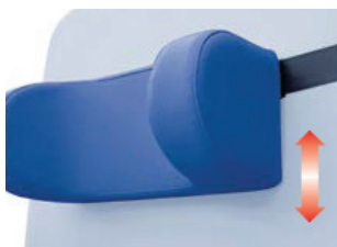
AC0949.W Kudde nacke lt4