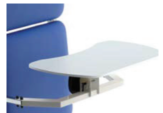
AC0915.060 Bord 60 i polyeten