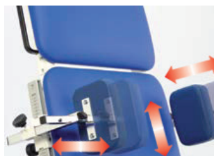
AC0922.W Vadderade stöd