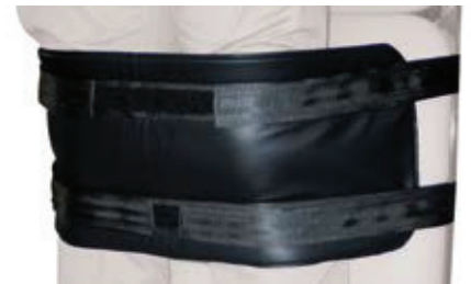
AC0088 Fixeringsrem knän 26 cm, 1 st