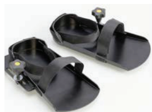
AC0002 Intra-extra sandaler