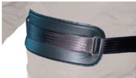
AC0560 Fixeringsrem bål 17,5 cm, 2 st