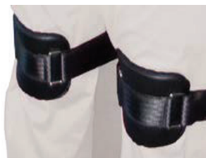
AC0561 Fixeringsrem Delad 17,5 cm