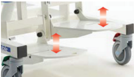
AC0944 Separat justerbara höjd/vinkel fotplattor