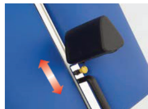
AC0911 Kil för ben